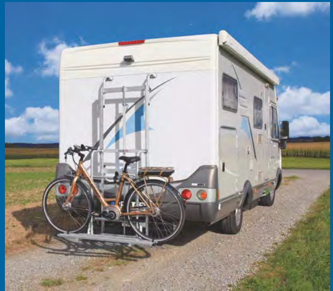
So sieht der tecklift connect aus

Sie haben bereits einen Fahrradträger am Heck Ihres Wohnmobils montiert? Dann ist der tecklift connect die richtige Wahl! Der tecklift connect wandelt Ihren vorhandenen Fahrradträger in ein Komfortmodell um. Er ist ein elektrisch betriebener Universaladapter. Montieren Sie den tecklift connect zwischen das Heck Ihres Reisemobils und Ihren vorhandenen Fahrradträger. Der tecklift connect passt sich Ihrem Reisemobil an. Die am Heck vorhandenen Befestigungspunkte können meist weiter verwendet werden.