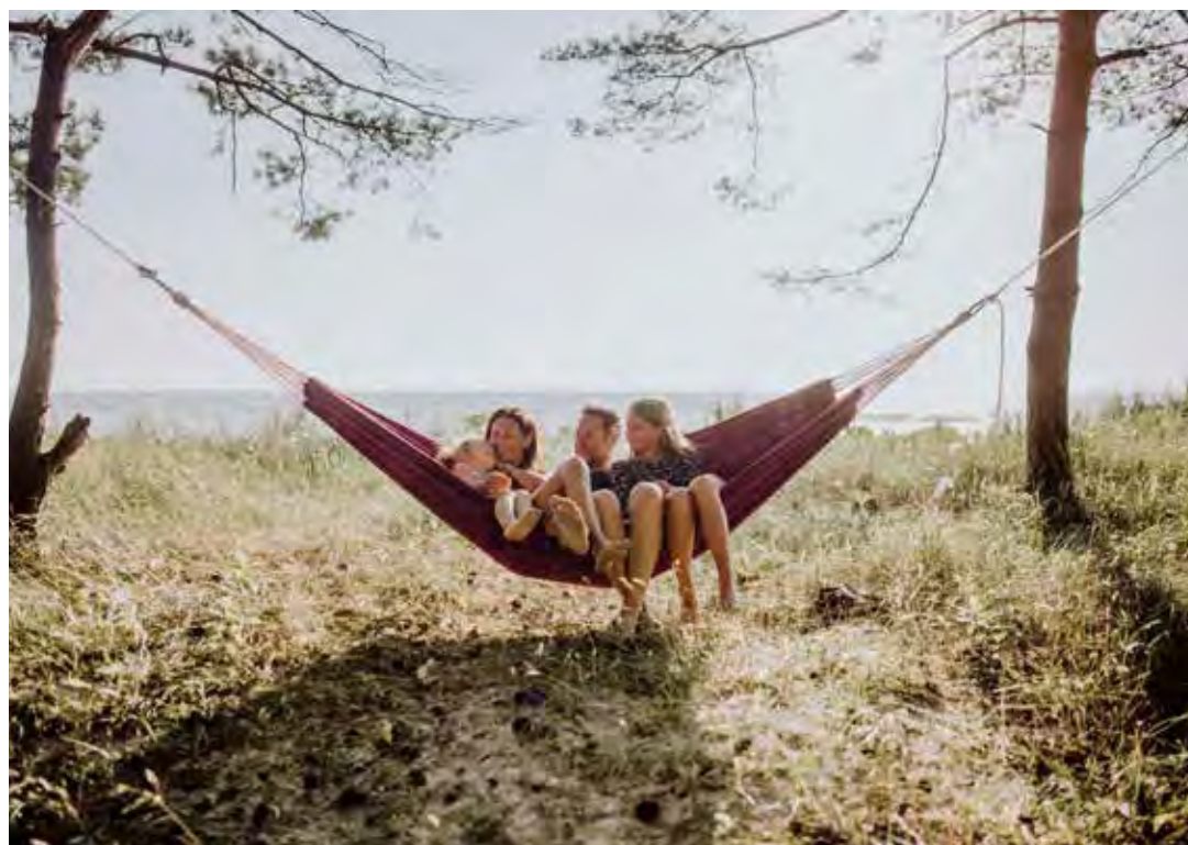
Platz für die ganze Familie unterwegs in den Amazonas-Hängematten

Bis heute produziert AMAZONAS Hängematten und Hängesessel in traditioneller Handarbeit in Brasilien und importiert diese nach Deutschland. Doch Hängematten sind nicht nur schick anzusehen, sie fördern nachweislich die Gesundheit, denn sie ermöglichen entspanntes Liegen: Mit der richtigen Liegetechnik wird einem ge-