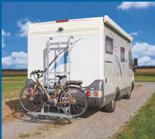
So sieht der tecklift connect aus

Sie haben bereits einen Fahrradträger am Heck Ihres Wohnmobils montiert? Dann ist der tecklift connect die richtige Wahl! Der tecklift connect wandelt Ihren vorhandenen Fahrradträger in ein Komfortmodell um. Er ist ein elektrisch betriebener Universaladapter. Montieren Sie den tecklift connect zwischen das Heck Ihres Reisemobils und Ihren vorhandenen Fahrradträger. Der tecklift connect passt sich Ihrem Reisemobil an. Die am Heck vorhandenen Befestigungspunkte können meist weiter verwendet werden.