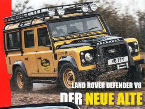
LAND ROVER DEFENDER V8

Das 4x4-Magazin für die Freiheit auf Rädern