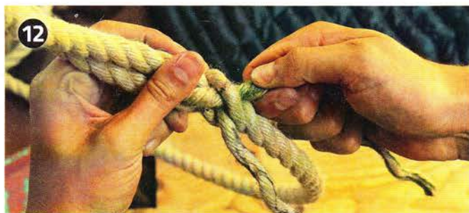
12 Check: Wurde das offene Kardeel je einmal unter einem festen Kardeel durchgeführt, ist der erste Durchgang geschafft.