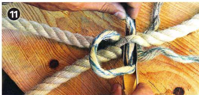
11 Drüber und drunter: Führt man das offene Kardeel 3 unter dem dritten festen Kardeel hindurch, entsteht diese typische Schlaufe.