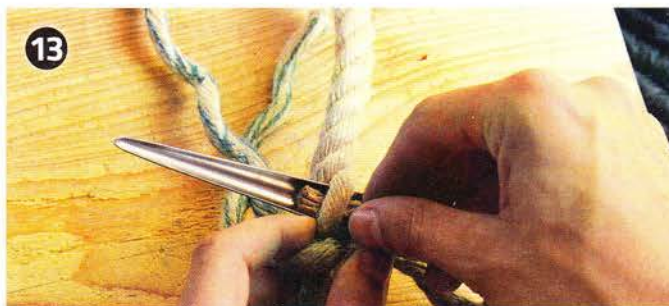
13 Zweiter Durchstich von Kardeel 2 (schwarz): Nach dem Festziehen der drei Kardeele geht es mit dem als ersten geführten Kardeel 2 weiter.