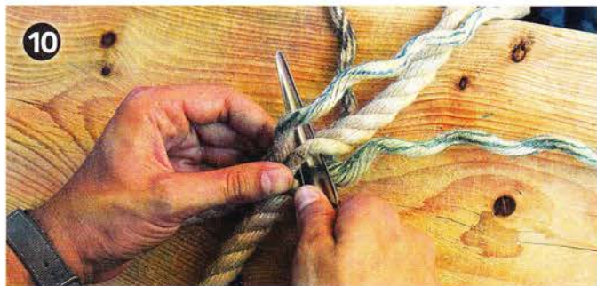
10 Durchstich Kardeel 3: Dieser Durchstich erfolgt von der bisherigen Unterseite aus, weshalb man Seil und Auge umdreht.