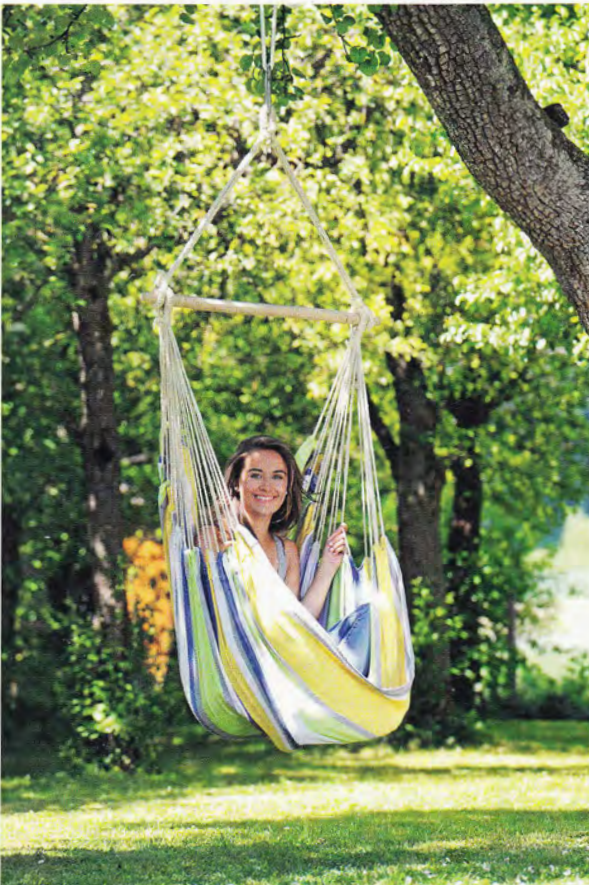
Die Seele baumeln lassen: Hängesessel „Relax kolibri“ von Amazonas