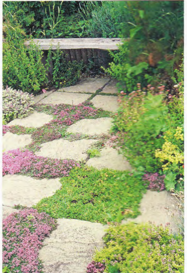
Duftweg: Sparen Sie ein paar Steine aus und bepflanzen Sie die Lücken mit Thymian oder Römischer Kamille.